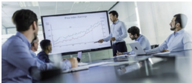
アパレル 代表取締役 男性 事業内容:服飾雑貨の製造・卸売・販売等

給与体系の設計と自社ECサイトの運営のアドバイスを受け、経営判断のスピードをアップ