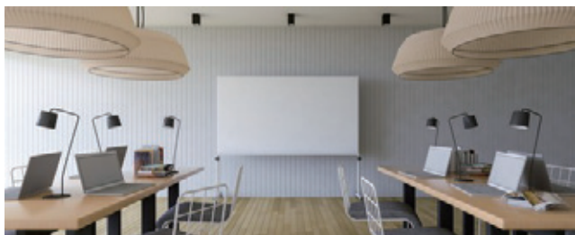
家具販売 代表取締役 男性 事業内容:高級デザイナーズ家具のオンラインショップ、デザイン家具ドットコムを展開