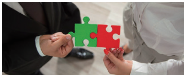
製造業 代表取締役 男性 事業内容:樹脂成形を中心に1次加工の成形から塗装、シルク印刷、レーザー、組立まで一貫生産で提供