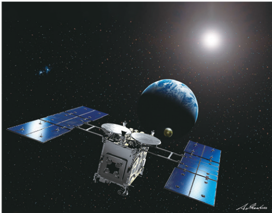
「小惑星探査機「はやぶさ1,2」のセンサー内にアトックで研磨した石英基板搭載」

当社は、石英ガラスをはじめとする光学ガラス、半導体素子等の研磨・研削・溶接加工を行っています。